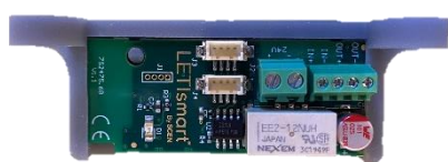
Fig.1 tag semaforo inserito nel supporto

IL 7V2475.67 COMPRENDE: TAG SEMAFORO 7S2475.68 + SUPPORTO IN PASTICA + BUZZER PIEZO